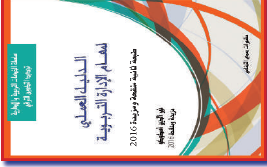
تأليف: ذ. نور الدين اسكوكو الطبعة الثانية: الثمن: 60 درهم

منشورات «صدى التضامن» سلسلة الخدمات التربوية والإدارية لتجديد التكوين للترقي وتتمية معرفة اطر وزارة التربية الوطنية في المجالات التربوية والإدارية والتشريع.