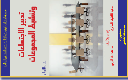
تأليف: ذ. عبد الطيف الجابري - ود. عطاء الله الأزمي الطبعة الأولى: الثمن: 40 درهم