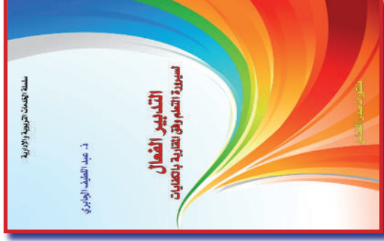
تأليف: ذ. عبد الطيف الجابري الطبعة الأولى: الثمن: 40 درهم