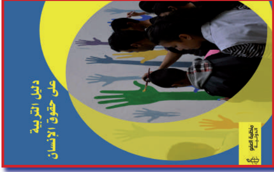
إعداد وتأليف: منظمة العفو الدولية الطبعة الثالثة: الثمن: 40 درهم